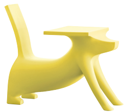
Matt colour Yellow 1569 C