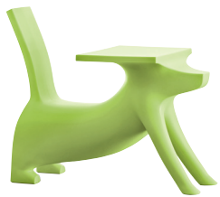
Matt colour Green 1315 C