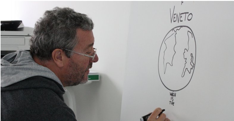
Designer chez Magis

Le Chien Savant s'est mis en tête de faire de tous les enfants des savants à son image. Quel dommage qu'il n'y ait pas un chien comme ça pour les grands !