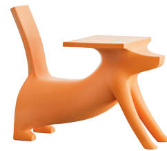
Matt colour Orange 1647 C