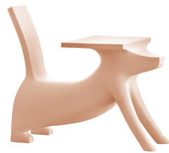
Matt colour Pink 1628 C