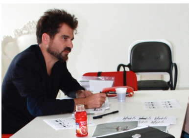
Designer chez Magis