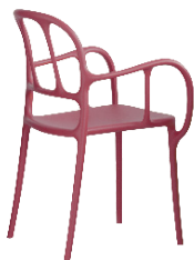
Matt colour Red 1484 C