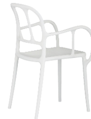
Matt colour White 1738 C