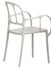
Matt colour Beige 1733 C