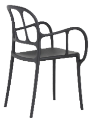
Matt colour Black 1769 C