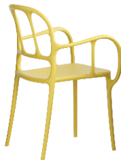
Matt colour Yellow 1666 C