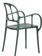
Matt colour Dark Green 1556 C