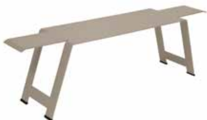
1015 - LE BANC Banc tôle acier 8 mm