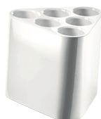
Glossy colours White 1673 C