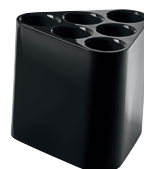
Glossy colours Black 1764 C