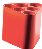
Glossy colours Orange 1088 C